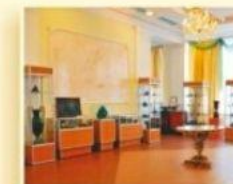
Уральский геологический музей ул. Хохрякова, 85