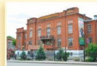
1-й уч. корпус ул. Куйбышева, 30 ГОРНОМЕХАНИЧЕСКИЙ ФАКУЛЬТЕТ ФАКУЛЬТЕТ ГОРОДСКОГО ХОЗЯЙСТВА