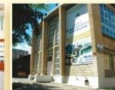
Дом спорта УГГУ ул. 8 Марта, 84А