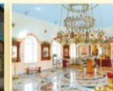
Храм Святителя Николая Чудотворца ул. Куйбышева, 39