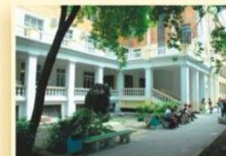
3-й уч. корпус ул. Хохрякова, 85 ФАКУЛЬТЕТ ГЕОЛОГИИ И ГЕОФИЗИКИ